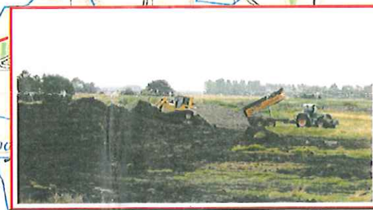
4. Nyt dige, nord for Sønderå Indvielse kl. 16.30