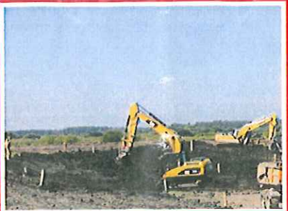
5 Neuer Deich, südlich der SüderAu