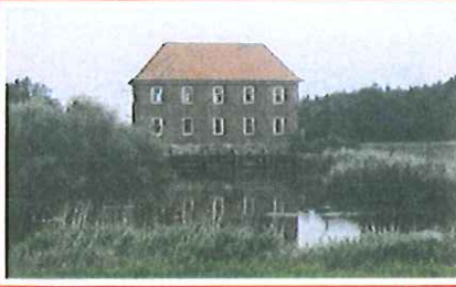
3. Lægan Pumpestation