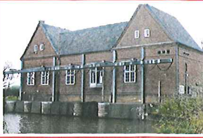
1. Schöpfwerk Verlatz