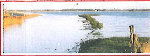
6. Hassberger See und Dreiharder-Gotteskoogstrom